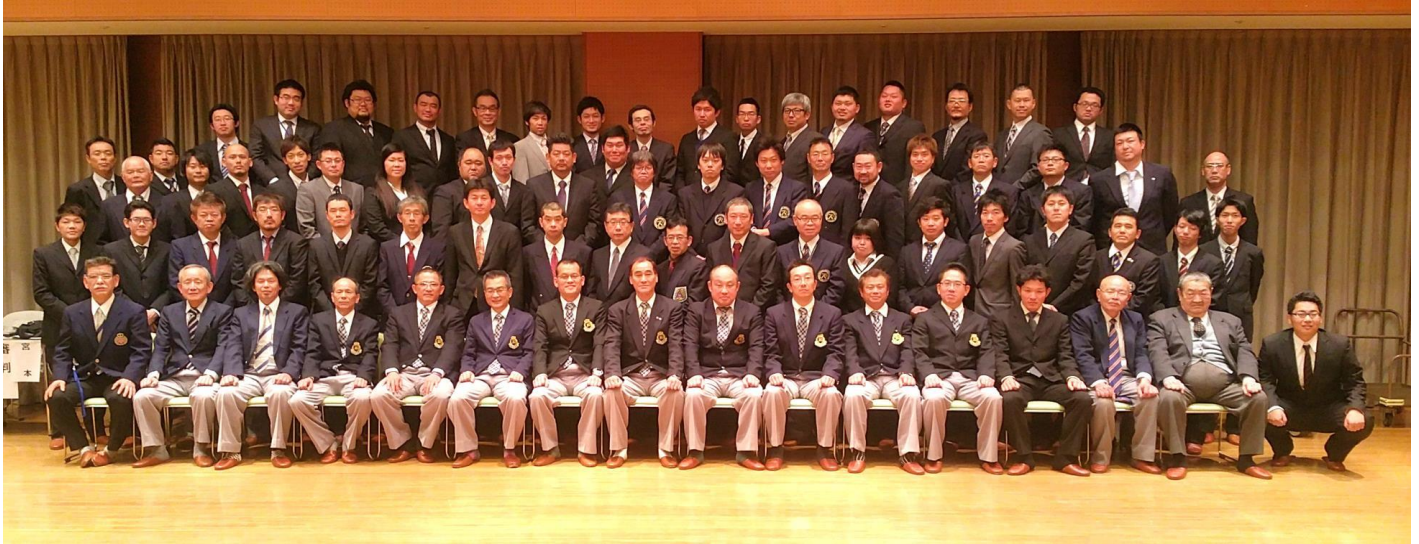
（平成27年2月7日（土）大阪府茨木市 茨木市民総合センター 多目的ホールにて）